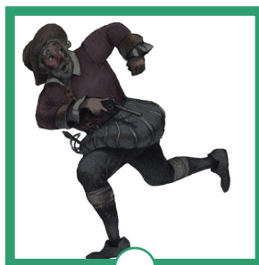
LE MERCENAIRE DU THÉODULE

EN OBSERVANT LES OBJETS DANS LES VITRINES, RELIE CHAQUE OBJET À SON PROPRIÉTAIRE.